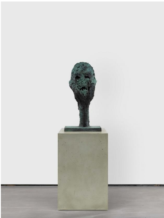
'The Ancient and Arcane', Huma Bhabha, 2021, Collection Michel Urbain. Met toestemming van de kunstenaar en David Zwirner, foto: Dan Bradica