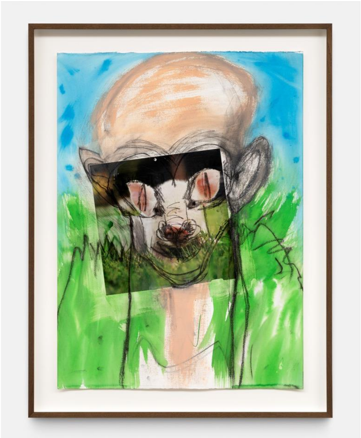
Untitled, Huma Bhabha, 2021.