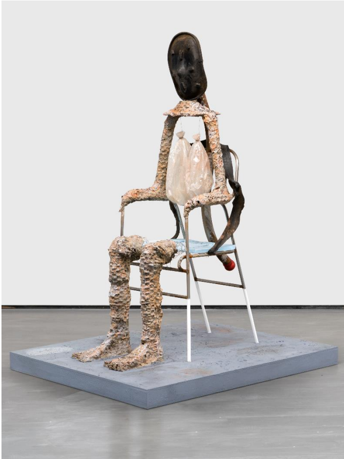
'Mask of Dimitrios', Huma Bhabha, 2019. Met toestemming van de kunstenaar en David Zwirner, foto: Dan Bradica.