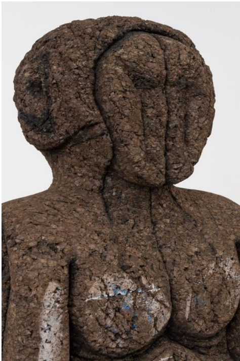
'The Ambitious One' (detail), Huma Bhabha, 2021, privécollectie. Met toestemming van de kunstenaar en Xavier Hufkens, Brussel