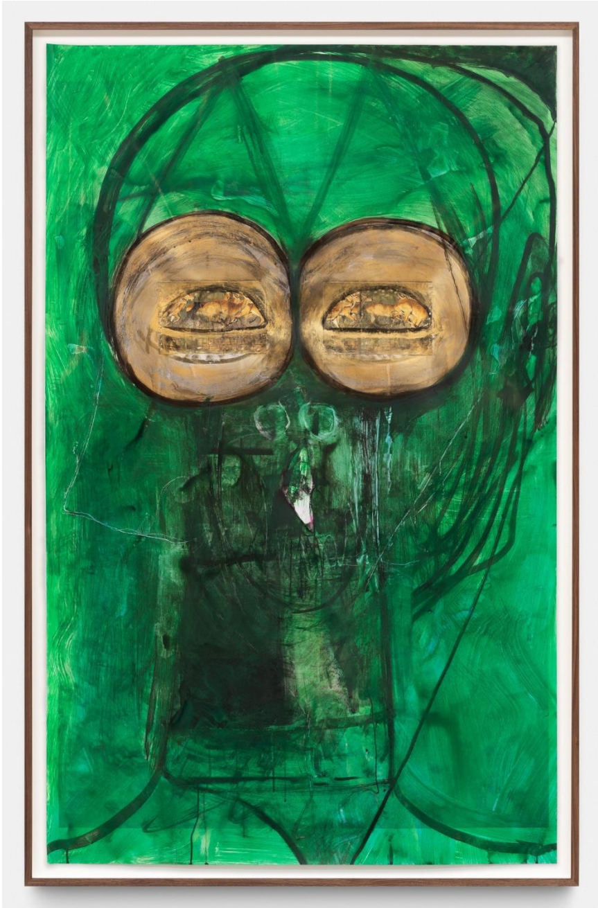
Untitled, Huma Bhabha, 2022. Met toestemming van de kunstenaar en Xavier Hufkens, Brussel, foto: HV-studio