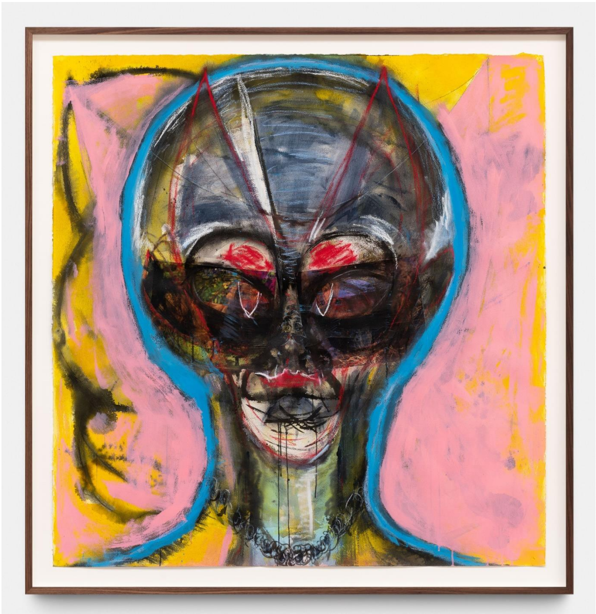
Untitled, Huma Bhabha, 2021, privécollectie. Met toestemming van de kunstenaar en Xavier Hufkens, Brussel, foto: HV-studio