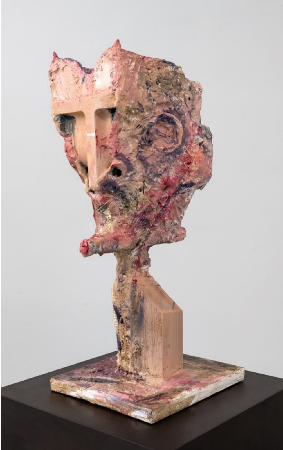
'Impossible' (detail), Huma Bhabha, 2021. Met toestemming van de kunstenaar en Xavier Hufkens, Brussel, foto: Adam Reich