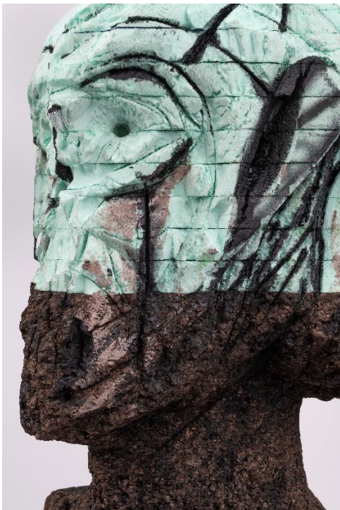
'I was Invited' (detail), Huma Bhabha, 2020, T&C Collection. Met toestemming van de kunstenaar en David Kordansky Gallery, foto: Adam Reich