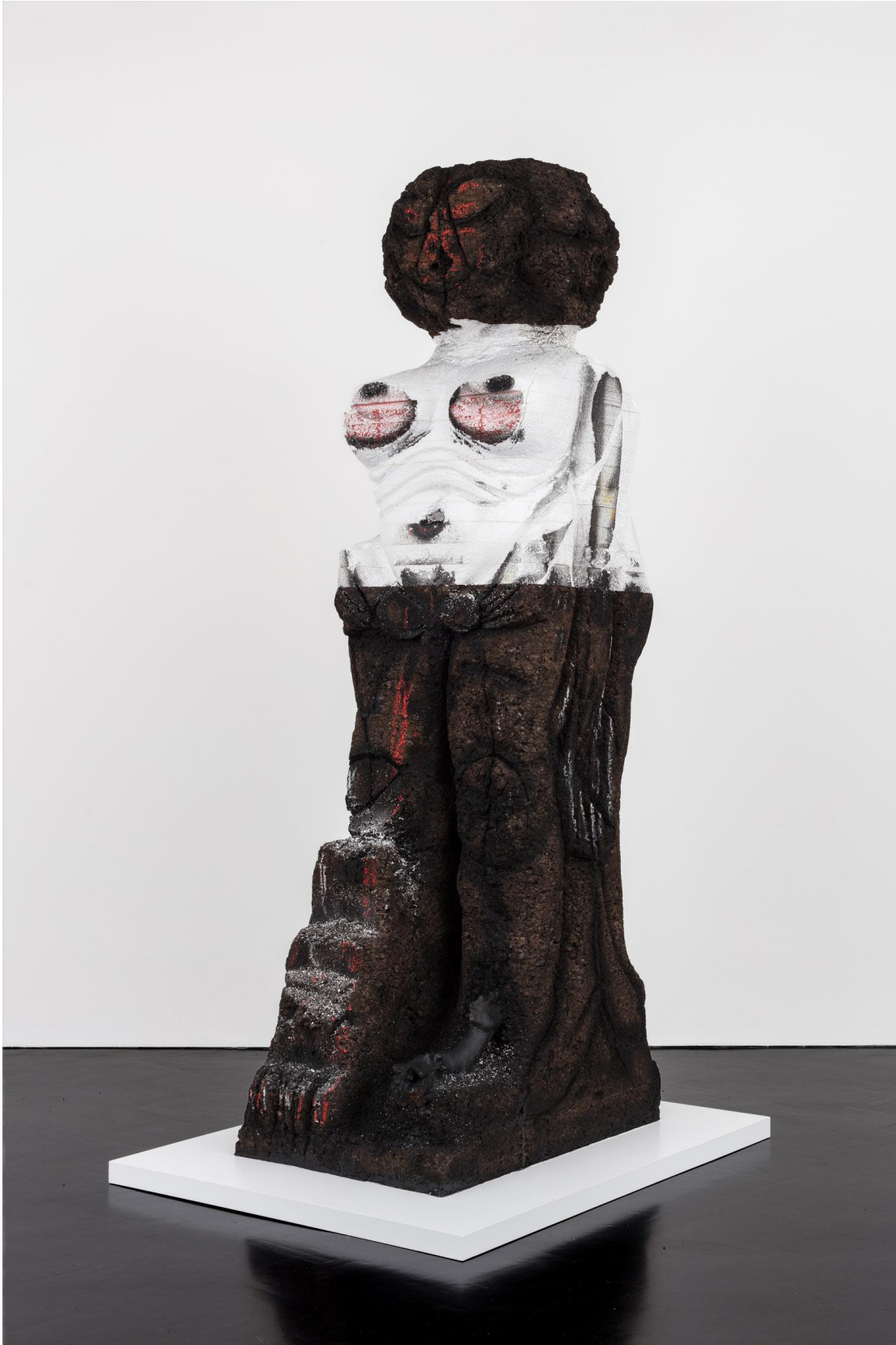
'Castle of the Daughter', Huma Bhabha, 2016. Met toestemming van de privécollectie, foto: Mark Blower